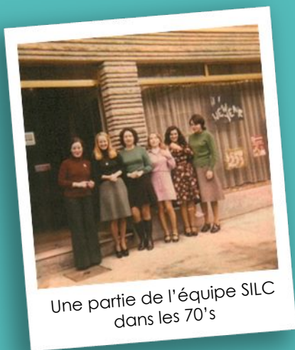
Une partie de l'équipe SILC dans les 70's

C'est le nombre de pays dans lesquels SILC propose des séjours avec cours d'anglais : Afrique du sud, Australie, Canada, USA, Grande-Bretagne, Irlande et Malte.