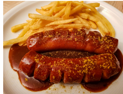
Le Currywurst (saucisse au curry) est une spécialité charcutière berlinoise