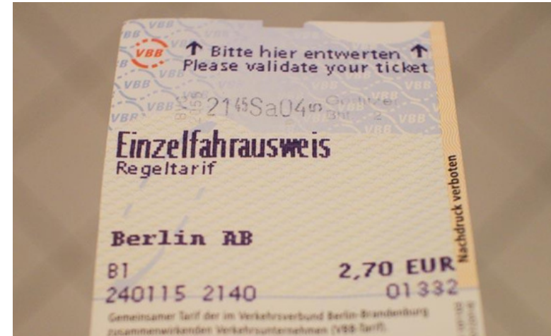
2,70 le ticket de métro à Berlin (zone A). A Paris, l'équivalent coûte moins de 2€