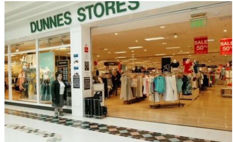
Dunnes store : une enseigne généraliste en Irlande